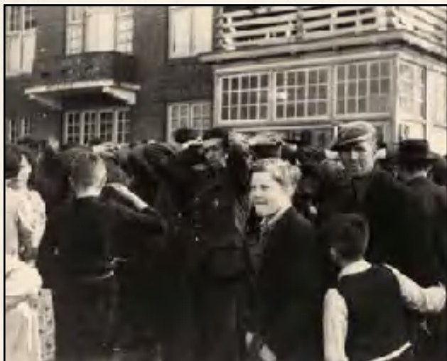
De bevrijding van Harderwijk: Een menigte Harderwijkers op de Strandboulevard voor Hotel Monopole. Tussen de mensen NSB-ers met de handen omhoog.