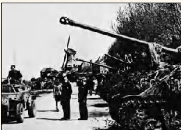
Canadezen op de Strandboulevard