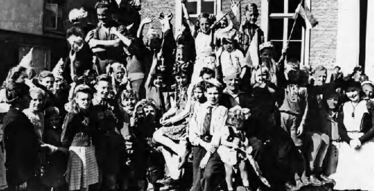
Markt. Bevrijding door de Canadezen