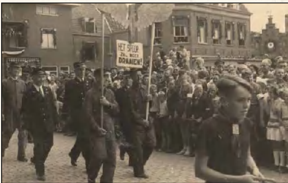
Markt. Spoorwegpersoneel in optocht tijdens een bevrijdingsfeest

U kunt zich aanmelden via www.herderewich.nl/lidmaatschap